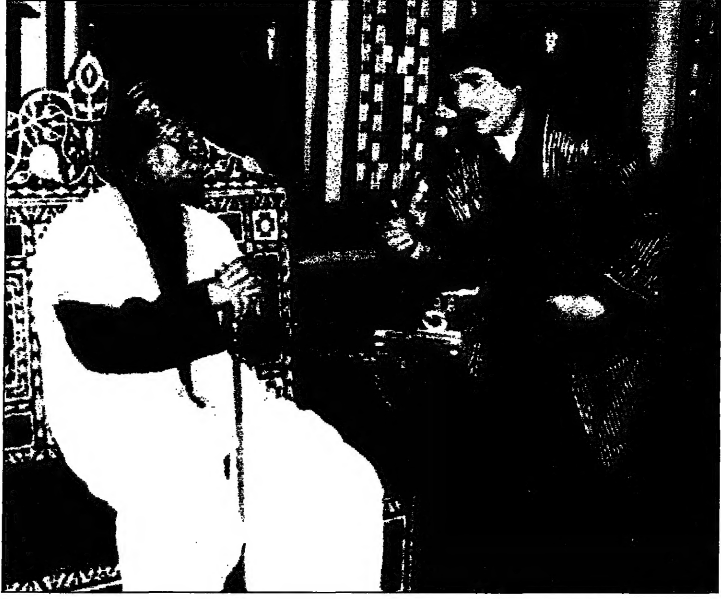
ياسر العظمة في مشهد من مرايا